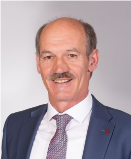
Bürgermeister ÖVP Ewald Fröschl